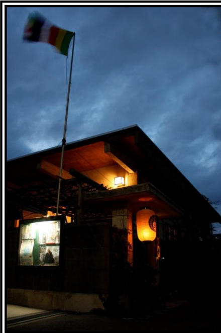
伝燈奉告法要団体参拝*平成29年4月28日